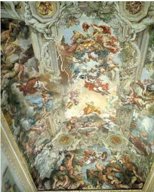
● Fig. 1 - Pietro da Cortona, 1632-1639, Il trionfo della Divina Provvidenza e il compiersi dei suoi fini sotto il pontificato di Urbano VIII Barberini (Salone di Palazzo Barberini, Roma).

In quest'affresco l'artista giunge a un risultato di tale complessità scenografica, da proporsi come la più matura e consapevole opera pittorica barocca realizzata a Roma. Su una base di finte membrature architettoniche, inserisce una quantità notevole di figure e immagini senza rispettare in alcun modo le cornici da lui stesso fissate. Ne scaturisce un risultato