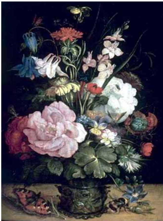
● Fig. 14 - Roelandt Savery (1578-1639), Bouquet de fleurs (1611/1612) (Museo delle Belle Arti, Lille).

metallo con bastoni 9 . Da notare, inoltre, che tutte le persone rappresentate sono dotate di maschere per prevenire le punture da parte delle api. Tutto ciò indica un buon livello tecnico dell'apicoltura dell'epoca; ma l'adozione di arnie non razionali (i cosiddetti bugni) obbligava gli apicoltori, al fine di raccogliere il miele, ad effettuare l'apicidio. Con l'introduzione dell'arnia semirazionale, prima, e razionale, poi, si è potuto raccogliere il miele senza arrivare all'uccisione delle api. Sulla