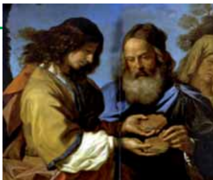
● Fig. 10 - Giovanni Francesco Barbieri detto Il Guercino (1591-1666), Sansone che porta il favo di miele ai genitori (The Fine Art Museum, San Francisco).