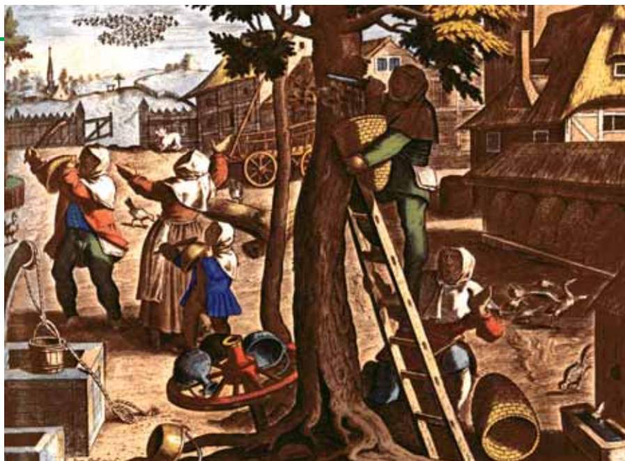
● Fig. 12 - Johannes Stradanus (1523-1605) - La cattura di sciami . Incisione.

Giovanni Francesco Barbieri detto Il Guercino (Cento, 2 febbraio 1591 - Bologna, 22 dicembre 1666) nel 1657 dipinse Sansone che porta il favo di miele ai genitori (fig. 10). Il dipinto è un eccellente esempio dell'uso