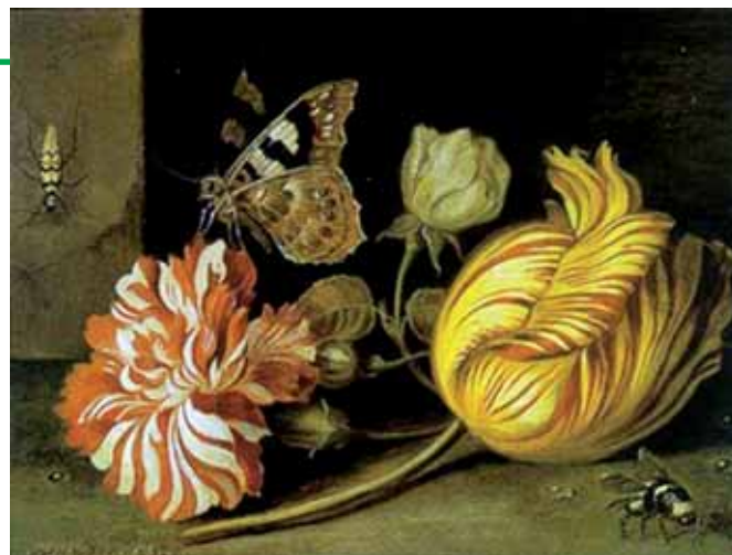
● Fig. 13 - Balthasar van der Ast, Studio di fiori e insetti , 1630 ca. (Galleria Noortman, Maastricht).

In un quadro del famoso pittore olandese Balthasar van der Ast (Middelburg 1593/94 - Delft 1657) intitolato Studio di fiori e insetti (fig. 13), sono raffigurati, accanto a esemplari botanici (un tulipano, un garofano e una rosa) anche alcuni insetti 10 : un coleottero cerambicide - un lepturino "idealizzato" -, un lepidottero