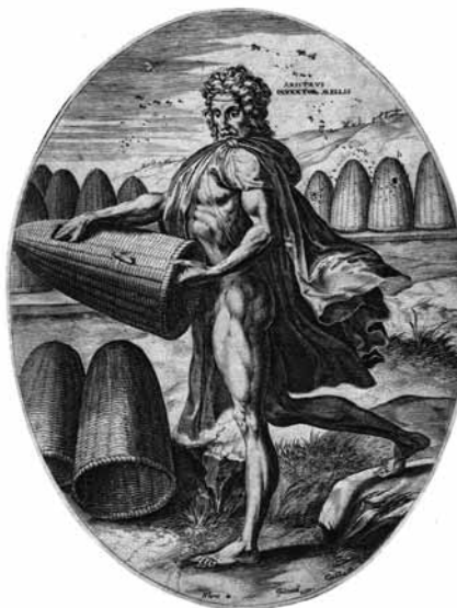
● Fig. 8 - Hendrick Goltzius (1558-1617), incisione su rame Aristeo, inventore del miele , seguendo un disegno di Frans Floris (1519-1570).

Seguendo un disegno di Frans Floris (o più correttamente Frans de Vriendt; Antwerpen, 1519 - Antwerpen, 1570), Hendrick Goltzius (Mühlbracht, 1558 - Haarlem, 1617), pittore e incisore olandese, eseguì questa incisione su rame (fig. 8). L'iscrizione in latino riportata dice: " Aristaeus, inventor mellis "; in essa è rappresentato l'eroe libico Aristeo (divinità antica pre-greca, figlio di Apollo e della ninfa Cirene) che tiene tra le mani un'ar-