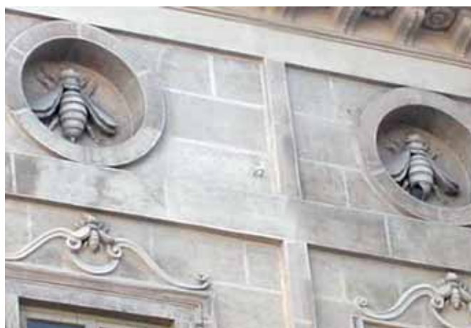
● Fig. 4 - Francesco Castelli (noto come Borromini, 1599 - 1667), api "barberiniane" sulle pareti del palazzo della Sapienza (Roma).