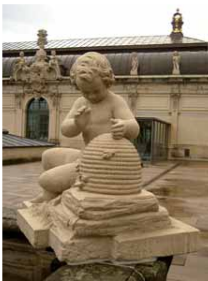
● Fig. 11 - Balthasar Permoser (1651-1732), Putto con alveare (Palazzo Zwinger a Dresda).