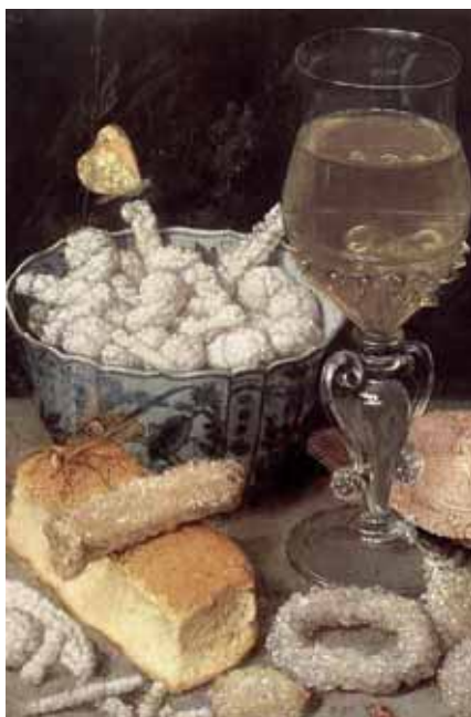
● Fig. 7 - George Flegel (1566-1638), Natura morta con pane e canditi (Städelsches Kunstinstitut, Frankfurt).