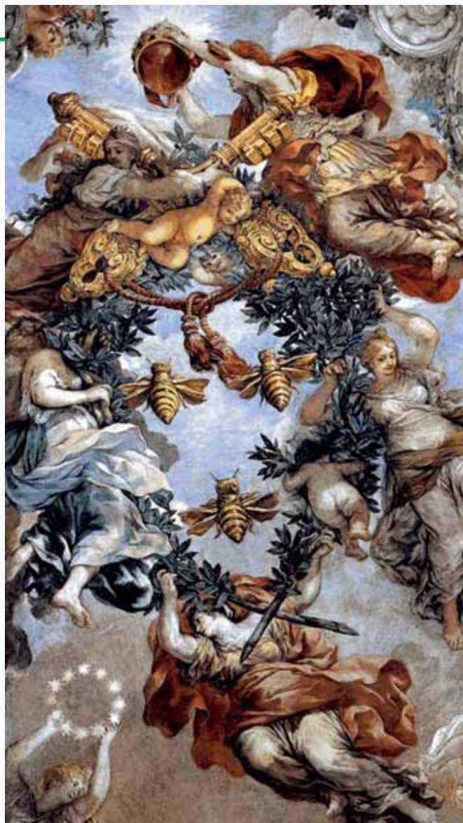
● Fig. 2 - La scena centrale con la Provvidenza e lo stemma Barberini.