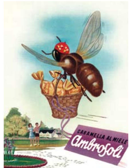
Fig. 9: l'immagine è molto interessante, per l'ambientazione gradevole, il cappellino infantile da "postino" con i fiori simbolici, la leggiadria del cestino 1 . In questo articolo si riportano esempi della presenza dell'ape nella pubblicità di articoli non strettamente collegati con l'apicoltura, se si va, infatti, nei prodotti apistici si trovano api a bizzeffe; però questa immagine (anche se Ambrosoli 2 vuol dire miele, quindi prodotto apistico per eccellenza) ha una giustificazione nella data: è presente nella rivista L'Illustrazione Italiana , Garzanti, Milano, 1953.

quattro azioni che il prodotto, a base di propoli (Influepid, www.specchiasol.it ) può svolgere per il benessere della gola e delle prime vie respiratorie in caso di sintomi influenzali: proteggere, prevenire, difendere, lenire;