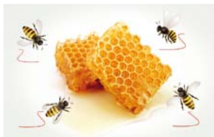
Fig. 8: le api stanno a indicare le

Fig. 7: immagine strettamente legata al tempo e quindi alla puntualità. Le api si sono sempre dimostrate puntuali ai loro appuntamenti con la raccolta del nettare e molto precise nella costruzione delle cellette dei favi. Nonostante questo, per comprendere a fondo l'abbinamento, bisogna leggere il messaggio della ditta che si autodefinisce competente, operosa e affidabile;