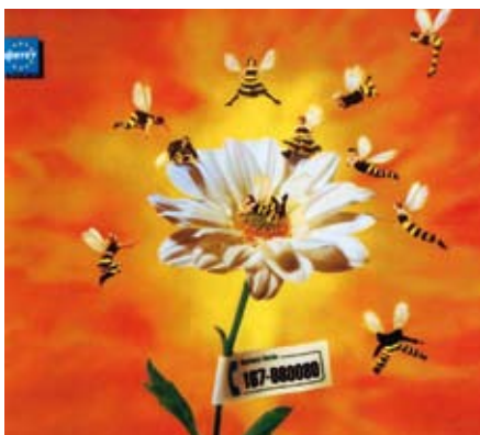
Fig. 5: L'immagine, festosa e solare, richiama il calore dell'estate, dando anche un messaggio di gioia;

Veste la Voglia di Fare (Fig. 4) è un marchio, del 2009, dedicato all'abbigliamento per il mondo dell'industria, dell'alimentare, dell'artigianato e dei servizi.