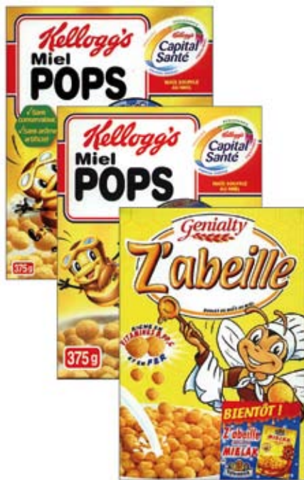
Fig. 14: questa immagine e le due successive fanno la pubblicità a un prodotto (palline di mais soffiato al miele) adatto per la prima colazione. La felicità dell’ape “aviatore” e dell’ape “chef” ricorda la serenità con cui bisogna vivere questo primo momento della giornata. Se la prima colazione viene fatta piacevolmente, si è ben predisposti per il resto della giornata; anche i “miel pops” e le “palline al

to: questa “dolce” entomofauna richiama un forte senso di “dolce golosità”, di torte al cioccolato e miele. Inoltre, essendo la coccinella nella tradizione popolare un insetto “portafortuna”, l’immagine è un felice augurio;