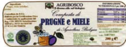
Fig. 15: questa immagine è di richiamo a prodotti naturali per sane colazioni e merende: altro che merendine “industriali”! Molto meglio le composte di frutta (prugne, mirtilli) e il miele.

miele” sono ottimi per la prima colazione.