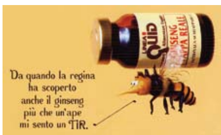
Fig. 19: immagine simpatica; l'abbinamento dà una sensazione di forza e di potenza.

po il fondatore, Oliviero Muccini, viste le richieste e comprese le enormi potenzialità del web decise di dare vita ad uno dei primi reparti e-commerce in Italia.