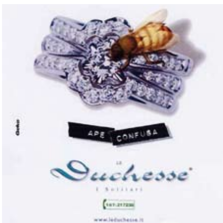
Fig. 6: intelligente, elegante e ari-

Fig. 5: L'immagine, festosa e solare, richiama il calore dell'estate, dando anche un messaggio di gioia;