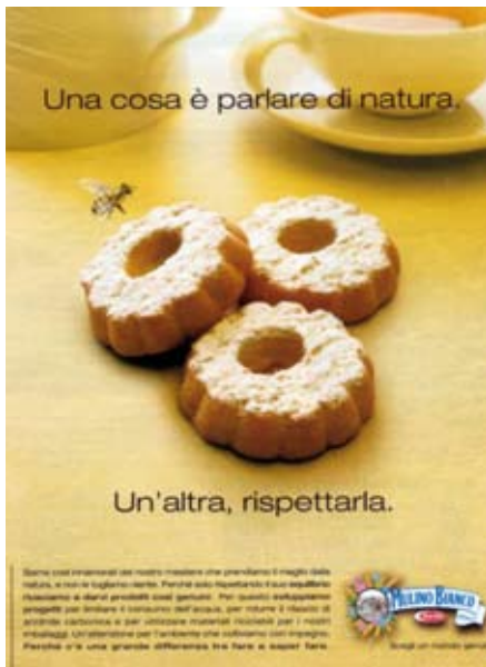
Fig. 10: in questo caso vi è un forte richiamo alla natura. Rispettare la natura (componente fondamentale dell'ecosistema) significa dare un contributo alla salvaguardia dell'ambiente in cui viviamo. L'ape, per trovare gli alimenti necessari, va a bottinare non solo sui fiori ma anche su altre fonti fornitrici di zuccheri quali la frutta in avanzato stato di maturazione e lesionata da diversi fattori (biotici e

abiotici) ma non certo sui biscotti: per questo l'abbinamento proposto (biscotti-ape) risulta di difficile comprensione;