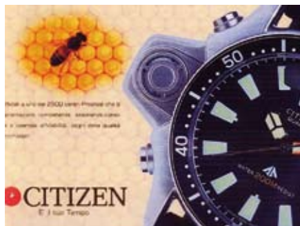
Fig. 7: immagine strettamente legata al tempo e quindi alla puntualità. Le api si sono sempre dimostrate puntuali ai loro appuntamenti con la raccolta del nettare e molto precise nella costruzione delle cellette dei favi. Nonostante questo, per comprendere a fondo l'abbinamento, bisogna leggere il messaggio della ditta che si autodefinisce competente, operosa e affidabile;

stocratico messaggio. I riflessi di luce sul gioiello attirano l'attenzione dell'eventuale compratore: un anello con diamanti potrebbe essere un ottimo dono d'amore. D'altra parte la scritta "ape confusa" denota una certa indecisione. Non sarà dovuta al fatto che l'insetto rappresentato non è un'ape operaia ma un fuco?