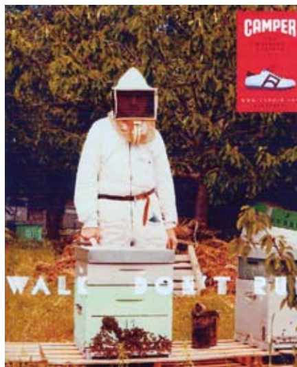
Fig. 16: anche per il lavoro ci vogliono calzature comode. Nel caso dell’attività apistica bisogna muoversi con accuratezza e senza agitazione: per questo occorrono anche scarpe adatte.

C) La capacità dell’ape operaia di difendere se stessa e l’alveare, utilizzando il pungiglione come arma sia contro potenziali aggressori che si avvicinano o entrano negli alveari per rubare il miele accumulato, sia contro coloro che la disturbano durante il lavoro di raccolta. Anche l’uomo, sia che esegua un atto volontario - come è il prelievo dei melari o le visite all’alveare da parte dell’apicoltore - sia che, involontariamente, frequentando luoghi in cui sono presenti le api, venga in contatto con questi insetti può subire le loro punture: