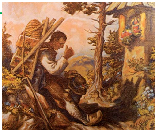
● Fig. 5 - Maksim Gaspari, Apicoltore porta i suoi alveari (Cebelar nosi panje) , (1935), collezione privata, Celje, Slovenia.

Tra queste si ricorda Apiario (Rucher) (fig. 6) , dipinto realizzato seguendo lo stile dell'impressionismo ancora vicini alla pittura paesaggistica tradizionale, quali Sisley e Renoir,