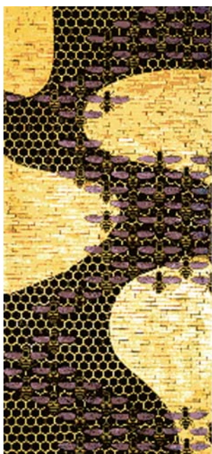
● Fig. 1a (sinistra) - Amedeo Bocchi, L'alveare (1915-16), Cassa di Risparmio di Parma e Piacenza, sede di Parma.

Amedeo Bocchi (nato a Parma il 24/8/1883 e morto a Roma il 16/12/1976) è una figura assolutamente singolare nella storia dell'arte del Novecento. Autore fin dai primi decenni del secolo di opere d'eccezionale significato, per la qualità intrinseca e per la partecipazione aggiornata e originale al contesto europeo, seppur apprezzato da importanti critici e studiosi, non ha ancora trovato il posto che gli compete nella storiografia artistica del secolo XX. L'opera riportata (fig. 1a) s'intitola L'alveare , essa è stata eseguita negli anni 1915-16 con tecnica mista (tempera, ecc.) per la decorazione, con l'affresco Il Risparmio , di una parete della Sala del Consiglio della Cassa di Risparmio di Parma e Piacenza, sede di Parma (oggi Cariparma). Questa, sala, progettata, preparata e realizzata fra il 1913 e il 1916