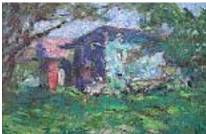
● Fig. 6 - Ludvik Kuba, Apiario (Rucher) , Castello di Breznice, Repubblica Ceca.

piuttosto che alle innovazioni visive realizzate dai "grandi" del periodo come Monet.