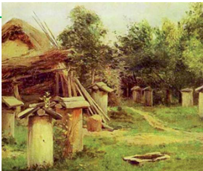
● Fig. 7 - Isaac Levitan, L'apiario (The Apiary) , collezione privata.

armoniosamente con la realtà dell'uomo, gli alberi che emergono ai lati della tavola non turbano con la loro presenza i sentimenti umani e lo spazio pittorico della scena.