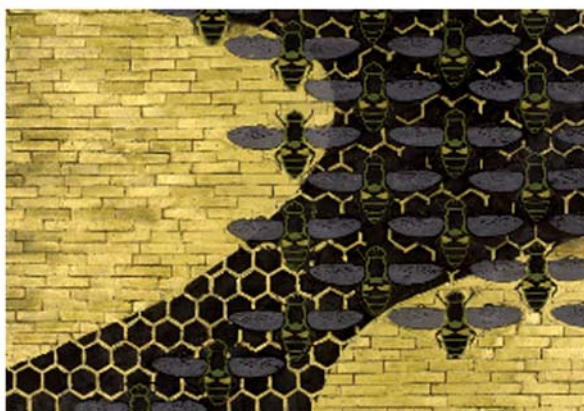
● Fig. 1b (sotto) - Amedeo Bocchi, L'alveare (1915-16) (particolare), Cassa di Risparmio di Parma e Piacenza, sede di Parma.