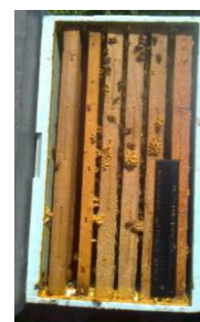
Beetle Blaster (Chemicals LAIF)

Nella "zona di protezione", dopo i roghi, sono state poste delle arnie esca e poi ritrovate ulteriori infestazioni di larve ed adulti del coleottero. Sono stati distrutti non solo gli alveari infestati ma anche quelli indenni , cioè l'intero apiario. E' stata bruciata plastica, polistirolo, lamiere zincate, tutto. In altre parti del mondo la convivenza col coleottero è meno problematica della varroa, si sono adottate tecniche di prevenzione e controllo. Di seguito alcune utilizzate in Apimarca: