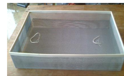
Gabbia 3 C