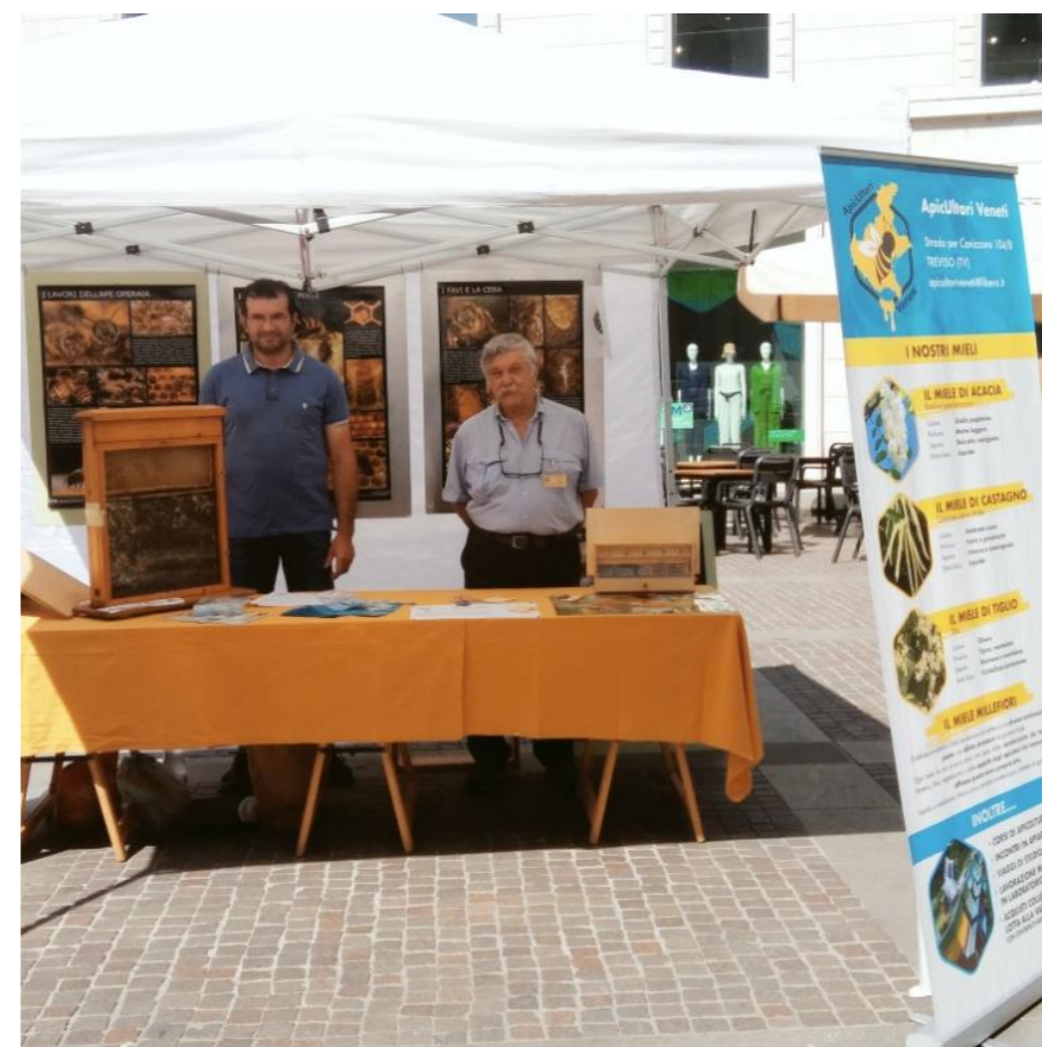
Lo stand di ApicUtori Veneti con Presidente e Segretario

L'attività di ApicUtori Veneti continua con la formazione, la promozione dell'apicoltura con lo stand a Treviso; abbiamo coordinato la raccolta degli sciami sul territorio; sono stati messi a disposizione dei soci ApicUtori i risultati delle bilance pesa alveari sparse sul territorio. Continua l'attenzione ai trattamenti obbligatori alla vite con opera di sensibilizzazione degli agricoltori. Ora ci aspetta il contenimento estivo della varroa, restiamo informati.