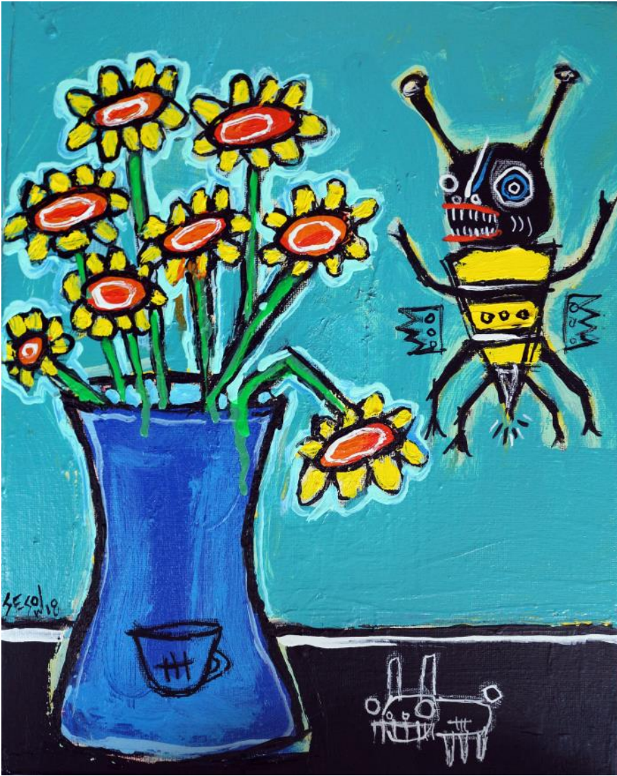
fig. 3 May flowers, with bee (2018) Copyright Matt Sesow (sesow.com)