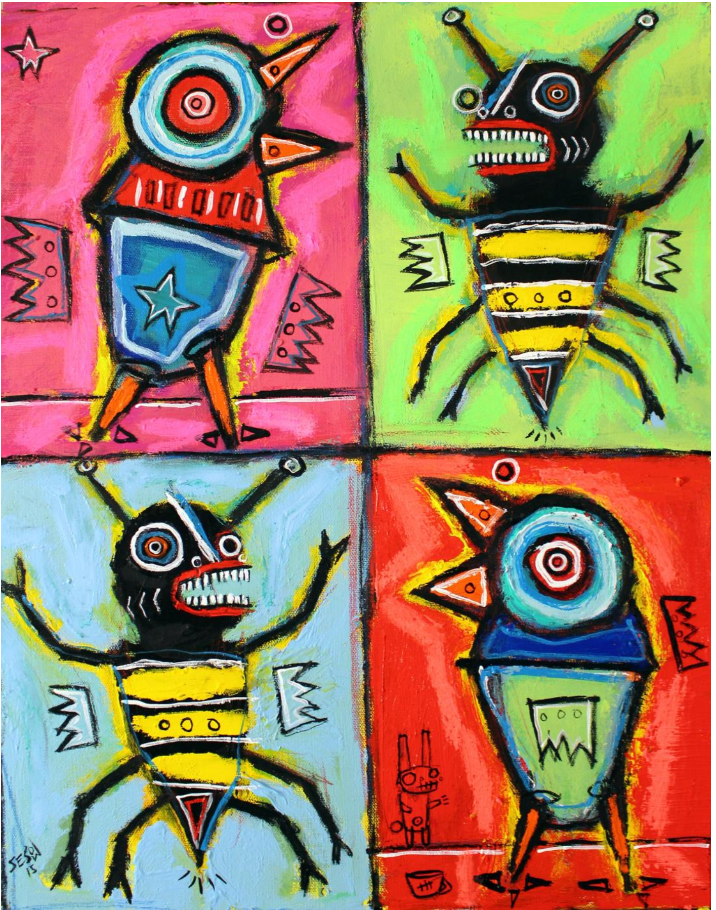
fig. 1 Birds and bees (2015) Copyright Matt Sesow (sesow.com)