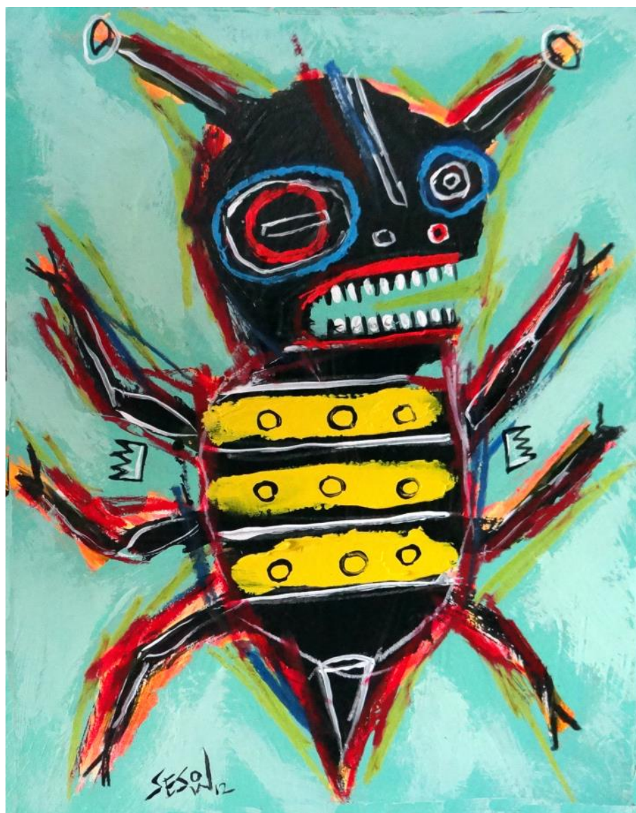
fig. 2 Bee Sample (2012) Copyright Matt Sesow (sesow.com)

Se nei quadri dell'artista statunitense si possono cogliere aspetti legati alla "Art Brut", letteralmente "arte grezza", essi sono caratterizzati dalla creatività fuori dagli schemi che ogni opera mostra nei suoi tratti. Il termine "Art Brut" è stato coniato nel 1945 dal pittore e intellettuale francese Jean Dubuffet con l'intento di dare una definizione precisa alla regione eterogenea di un'arte di confine, scevra da condizionamenti culturali. Un'arte che, secondo il suo teorico, accomuna opere realizzate da persone libere da ogni condizionamento di cultura artistica. Una libertà di linguaggio che trova una particolare e benefica presenza in quelle piccole api, pronte a spostarsi in ogni